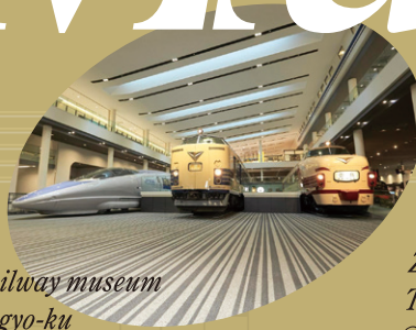
kyoto railway museum @Shimogyo-ku