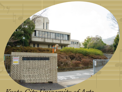
Kyoto City University of Arts @Nishikyo-ku