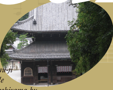
Sennyu-ji Temple @Higashiyama-ku