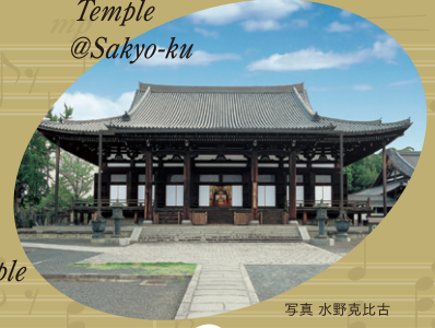
Kurodani Konkai-Komyoji Temple @Sakyo-ku