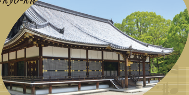
Ninna-ji Temple @Ukyo-ku