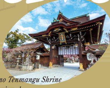
Kitano Tenmangu Shrine @Kamigyo-ku