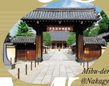
Mibu-dera Temple @Nakagyo-ku