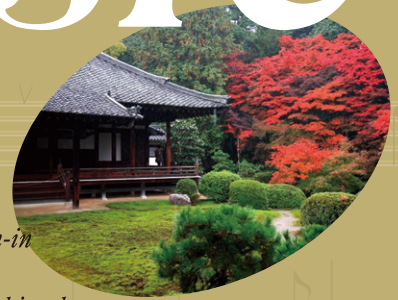
Zuishin-in Temple @Yamashina-ku