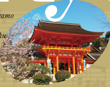
Kamigamo Shrine @Kita-ku